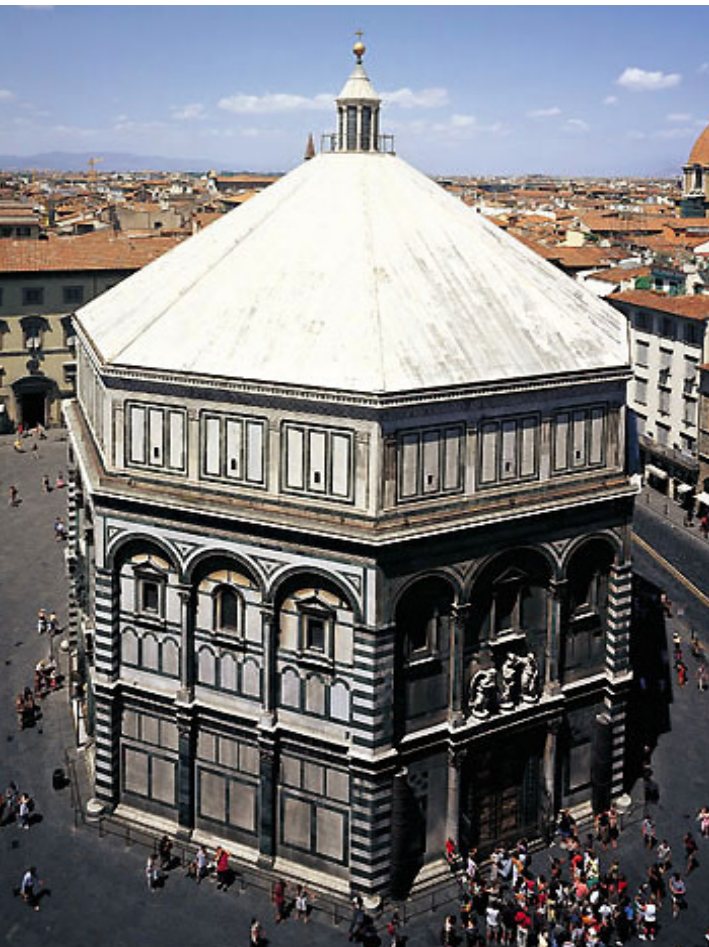
Porta EST (lato duomo) Ghiberti, 1403-1424 Nuovo Testamento (ora porta nord)