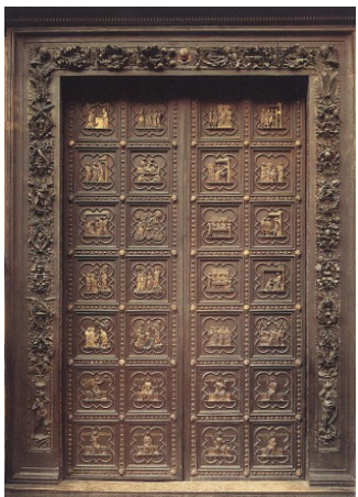
Porta SUD (lato città) Andrea Pisano, 1330-1336 Storie di san G. Battista